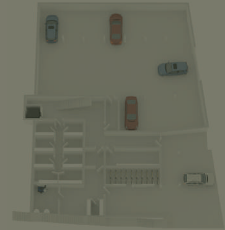
Tiefgarage / Keller