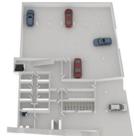
Tiefgarage / Keller